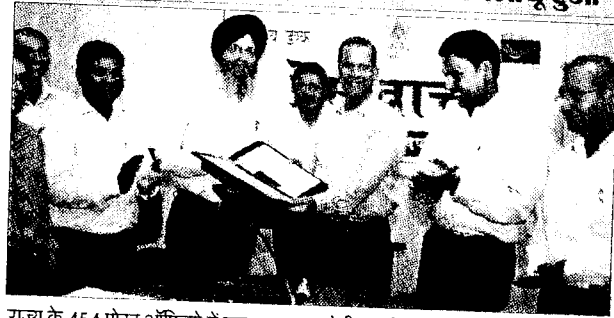
राज्य के 454 पोस्ट ऑफिसों में एक साथ शुरू होगी यह सेवा।